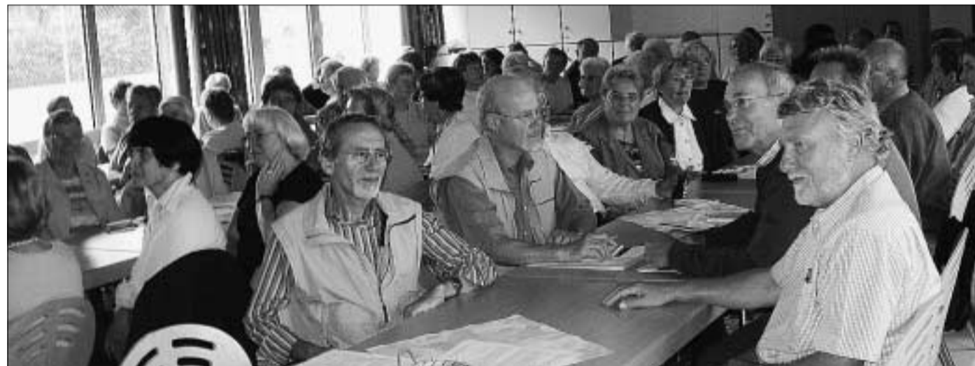
Gut besucht: Viele Teilnehmer weilten beim Netzwerkfrühstück, um sich über das neue Programm und seine Höhepunkte zu informieren.

Die verschiedenen Arbeitskreise stellten unterdessen ihre neuen Programme vor: Der Arbeitskreis Betriebsbesichtigungen bietet wieder viele Ausflüge an, los geht es am Donnerstag, 25. August ins Ruhrgebiet. Hier soll das Schiffshebewerk Henrichenburg besichtigt werden, dann geht es zum Stadion des FC Schalke 04 in Gelsenkirchen, und schließlich gibt es eine Führung durch das Stallgelände auf der Trabrennbahn. Die Kosten